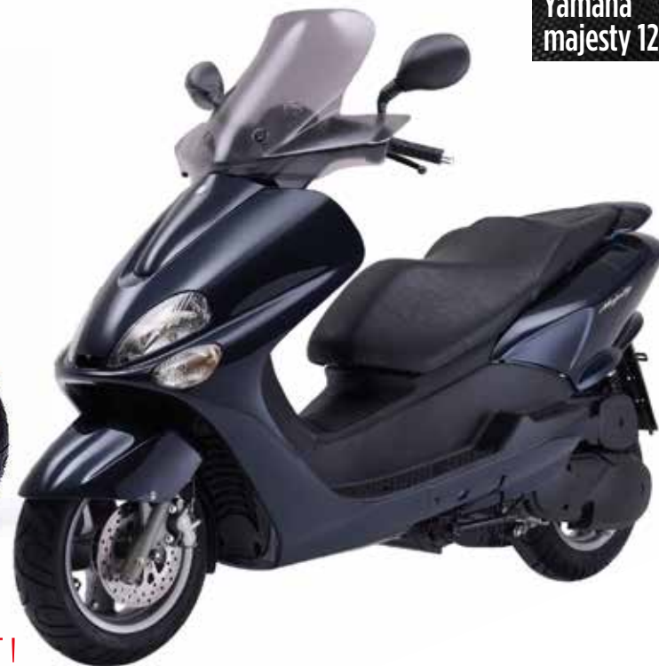
Yamaha majesty 125