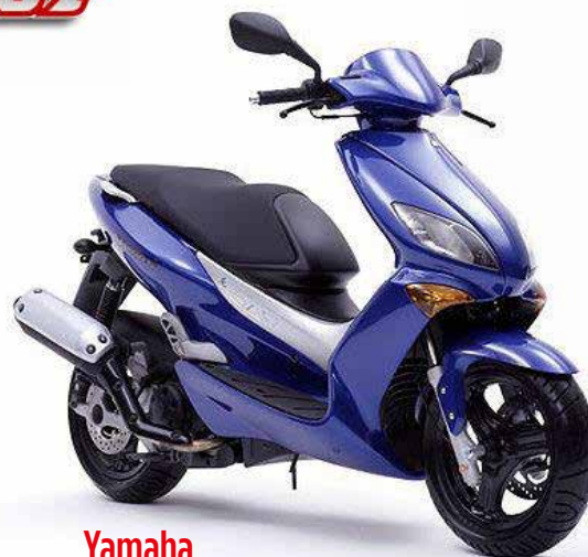
Yamaha 125 maxster

L'atelier du 92 rue de la Condamine Paris 17 e avec le pont élévateur artisanal